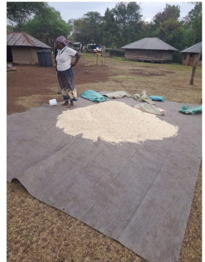
Voedselhulp in Kenia

Wij blijven ons, met uw hulp, inzetten om het leven voor de mensen in de arme landen iets draaglijker, maar vooral beter te maken. Dat doet de stichting al sinds 1980.