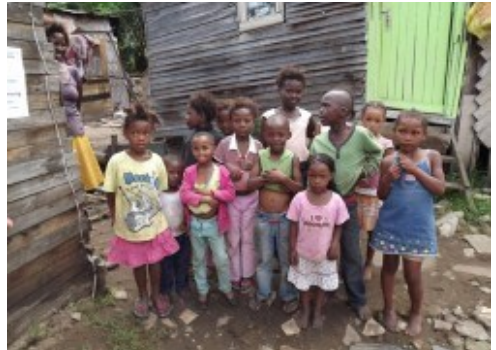
Een gezin in Zuid-Afrika dat wordt ondersteund

Dat blijft ook hard nodig, want in veel van deze landen zijn de situaties zeer moeilijk. Onze contactpersonen in die landen doen hun goede werken onder moeilijke omstandigheden en ook hen zijn wij veel dank verschuldigd. Dit jaarverslag geeft u hopelijk een goed beeld met betrekking tot het reilen en zeilen van de stichting in het afgelopen jaar.